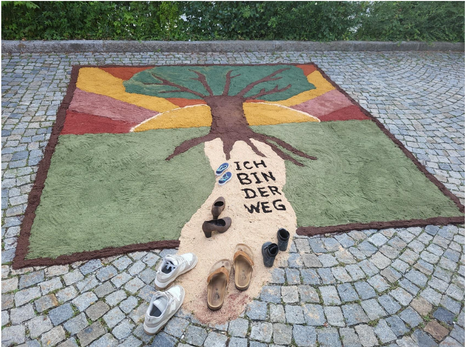
Fronleichnam 2025 in Attenkirchen

„Empfängt, was ihr seid, und werdet Was ihr seid: Leib Christi“.